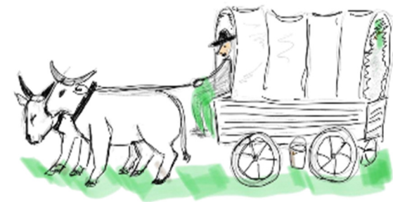
Prærie - ston nert

Den videre tur i Amerika foregik med tog, men hvis man ville videre vest på mod de store landbrugsarealer på prærien, foregik turen med Prærieskonnerter (trækvogne forspændt okser eller heste) eller man brugte apostlenes heste (man vandrede).