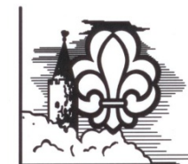
1. Kong Volmer Gruppe VORDINGBORG