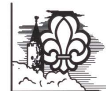
1. Kong Volmer Gruppe VORDINGBORG